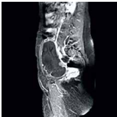
Figura 1. Imagen de resonancia magnética que demuestra la tumoración de origen anexial anterolateral al útero.

El anexo izquierdo y el útero estaban normales. El resultado de la biopsia por congelación sugirió la posibilidad de neoplasia ovárica epitelial. Se realizó lavado peritoneal, resección de la lesión, histerectomía total más ooforosalingectomía bilateral, disección de ganglios linfáticos pélvicos-paraaórticos y omentectomía parcial.